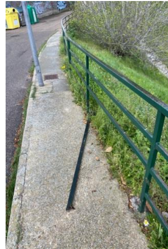
Acceso deteriorado a la pasarela y su entorno. Falta de iluminación en la subida.