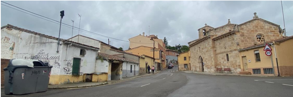
Plaza del Espíritu Santo, un lugar para adecentar y poner en valor.

Se debería prestar atención a la seguridad vial en determinadas zonas del barrio, especialmente la subida de la cuesta del Espíritu Santo y la Calle Guimaré, por la que discurren los coches en ocasiones a gran velocidad.