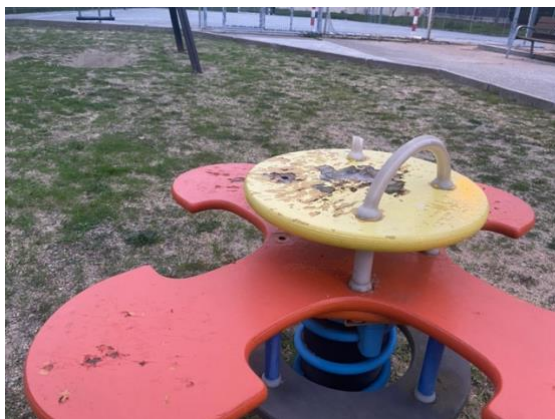
Parque infantil de San Isidro

Muchas calles necesitan una reforma urgente para mejorar las aceras y adaptarlas a las personas más necesitadas. Hay tramos de aceras en calles que llevan sin tocarse desde los años 80. Especial atención requiere la subida desde la N-122 hasta el barrio de San Isidro , un espacio degradado y muy utilizado por los vecinos.