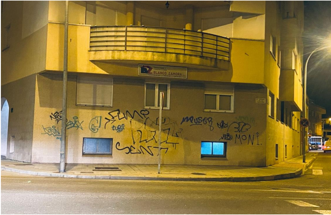
Firmas y pintadas en la zona de La Vega.