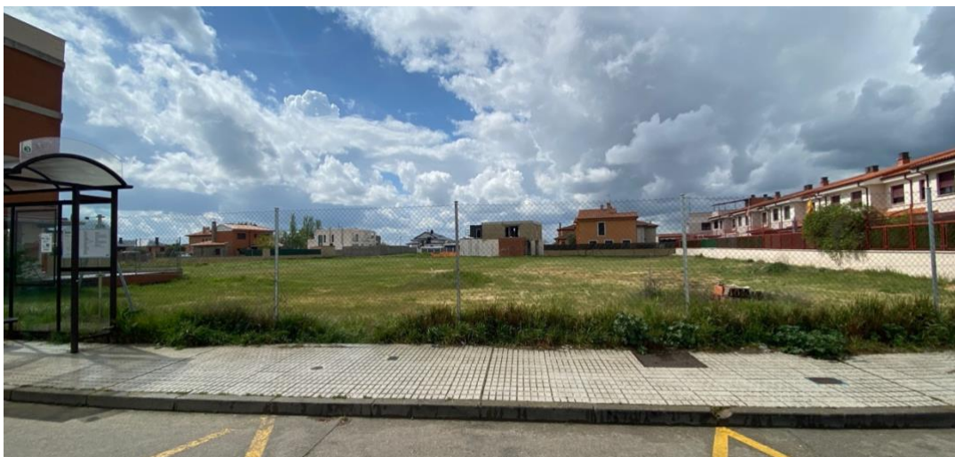
Parcela de San Isidro en la que se proyectaron por parte del Ayto. de Zamora diferentes actuaciones deportivas que jamás se llegaron a ejecutar.

Es interesante señalar que el único bar de San Isidro acoge el último billar romano que queda en la ciudad de Zamora, un deporte tradicional que hay que mantener.