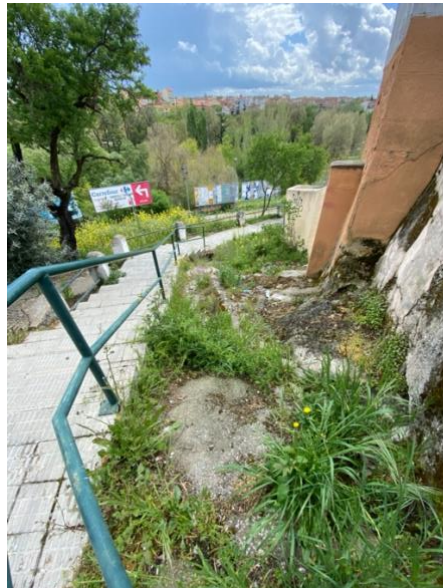
Aceras que llevan sin ser adecuadas desde los años 80 según nos cuentan los vecinos.