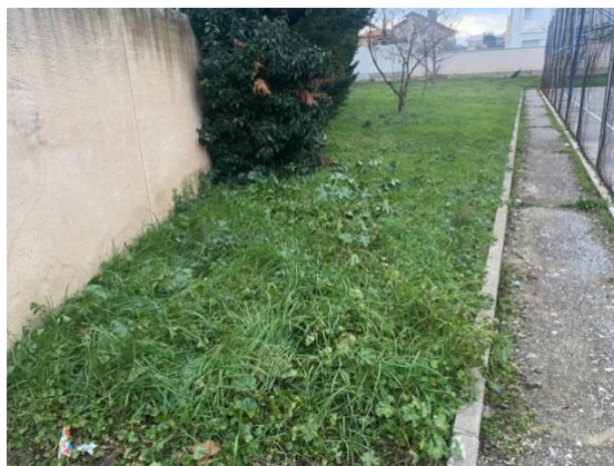
Jardines del barrio.