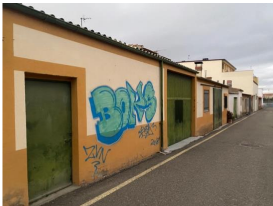
Daños de los pintamonas contra el patrimonio privado en San Isidro y Obelisco