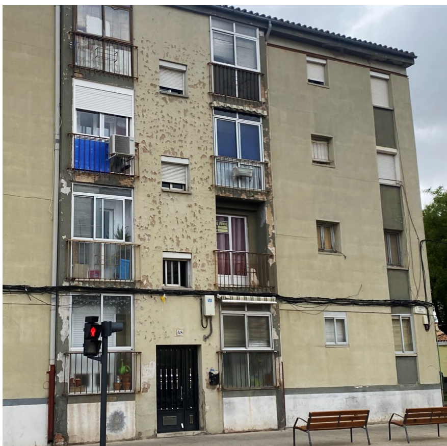
Fachada de bloque de viviendas en el barrio de San José Obrero

El camino emprendido por la ciudad de Zamora para el reconocimiento de “Paisaje cultural” por parte de la UNESCO es incompatible con el actual estado de conservación de las fachadas de una parte significativa del parque local de viviendas.