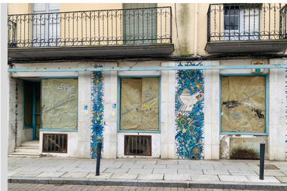
Moisacos antiguo comercio “La Sopera” del artista Luis Quico (Zamora, 1931 – Zamora, 2008)) Edificación dentro del área del Plan Especial de Protección del Conjunto Histórico de Zamora pero que no cuenta con protección ninguna.