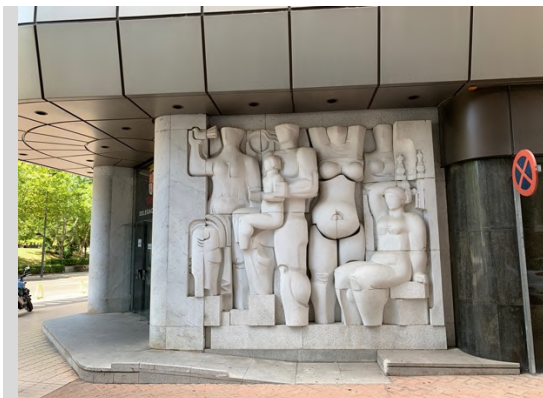
Relieves “Caja y sociedad” (1986) en mármol de Carrara del escultor Higinio Vázquez García (El Pego, Zamora, 1930)

Para poner freno a este proceso destructivo proponemos, además de fomentar campañas de divulgación, catalogación y diseño de rutas, establecer los mecanismos legales adecuados para asegurar la protección los siguientes elementos artísticos y garantizar el legado a las generaciones venideras: