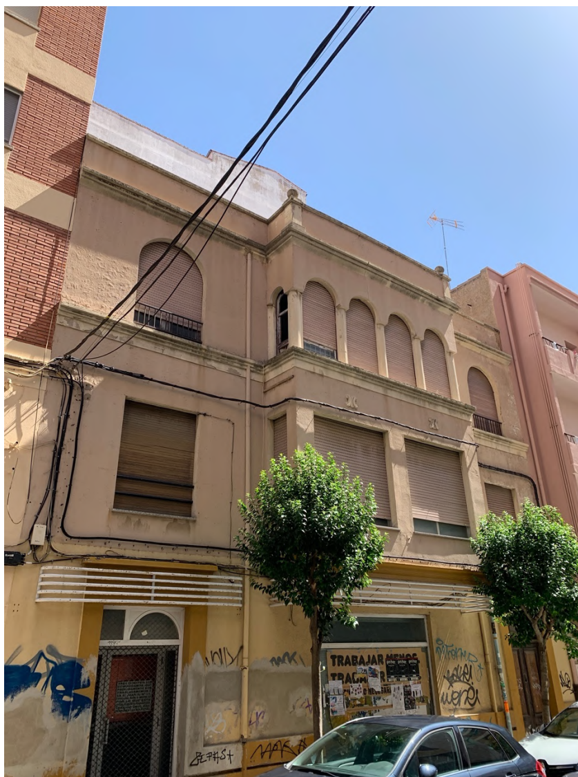
Fotografía del número 2 de la calle Juan II