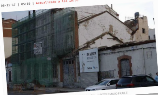
Aspecto exterior de la Panera Social durante los trabajos de derribo.

06-11-17 | 05:59 | Actualizado a las 10:53