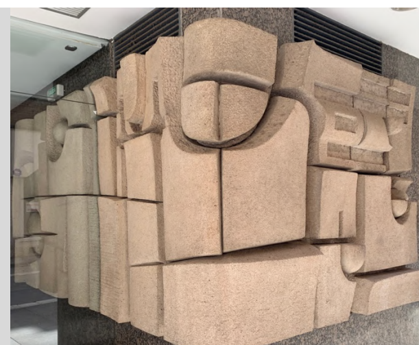
Relieves en hormigón en la antigua subcentral de Caja Zamora del escultor Higinio Vázquez (El Pego, Zamora, 1930) Edificación dentro del área del Plan Especial de Protección del Conjunto Histórico de Zamora pero que no cuenta con protección ninguna. Calle San Torcuato, 19