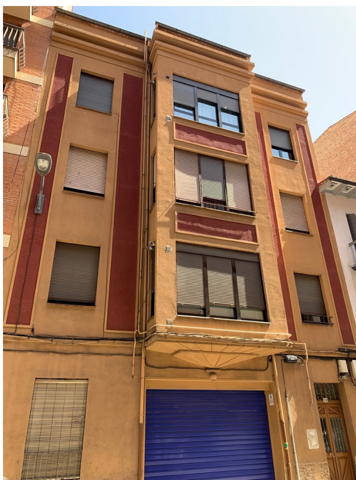
Fotografía del número 19 de la calle Regimiento de Toledo