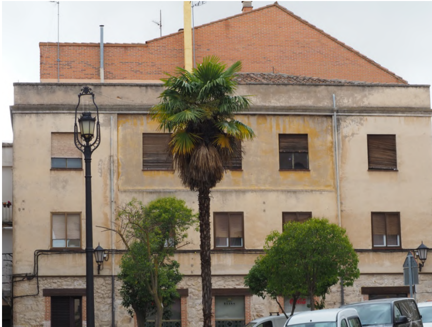
Estado de las fachadas de bloque de viviendas ubicado en la Plaza Santa Eulalia