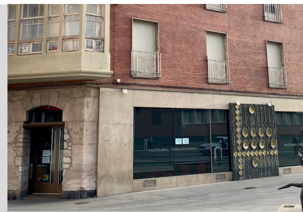
Mural escultórico antiguo comercio “García Casado” (actual Pastelería Torrehermosa) del artista Luis Quico (Zamora, 1931 – Zamora, 2008)) Edificación dentro del área del Plan Especial de Protección del Conjunto Histórico de Zamora pero que no cuenta con protección ninguna. Calle San Torcuato, 45