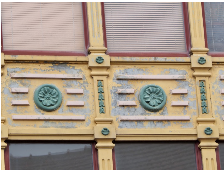
Detalle de la fachada de la vivienda de la esquina de Travesía con Plaza del Mercado. Atribuida a Francesc Ferriol (1908)