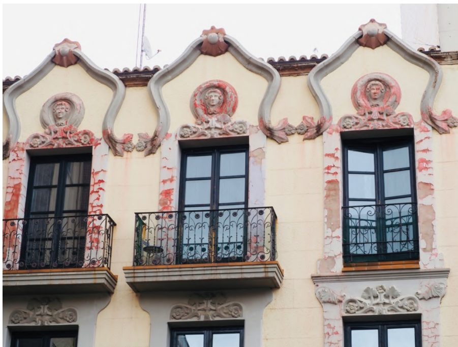
Detalle de la fachada de la Casa Cristanto Aguiar (1909) del arquitecto barcelonés Francesc Ferriol. Plaza del Mercado