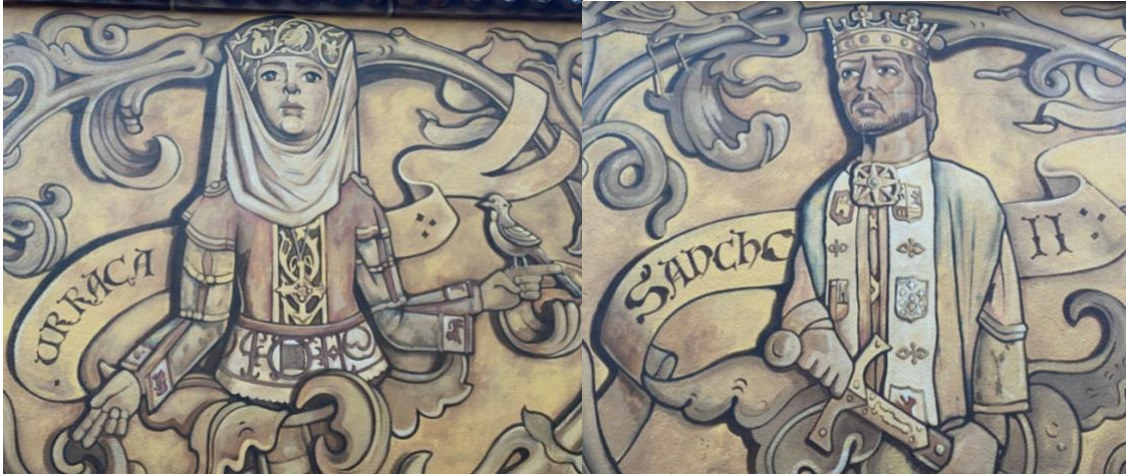
Urraca y Sancho II, mural urbano en Calle San Martín. Autor: Carlos Adeva, 2021.

Gobierno Foto portada: Detalle del mural “El Cerco de Zamora” (1964) de Antonio Pedrero. Sede de la Subdelegación del en Zamora.