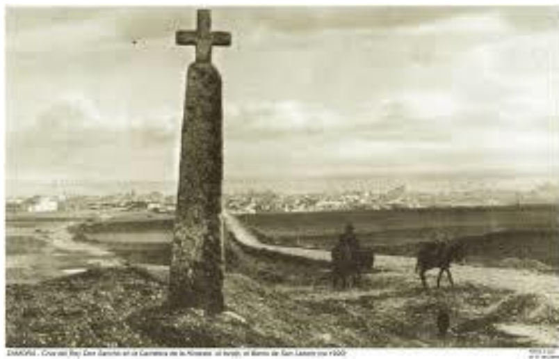
El Campo de la Verdad - Cruz del Rey Don Sancho en el Campamento de los Nobres, al sur de la Hiniesta, en el barrio de San Lázaro por 1900

El lugar actualmente ubicado en la carretera de La Hiniesta, junto al polígono del mismo nombre, en el que la tradición señala el lugar sobre el que estaba ubicado el campamento del Rey Sancho II y en el que falleció herido por el venablo de Vellido Dolfos.