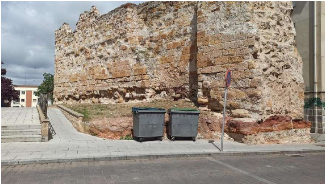
Muralla de Zamora, Calle Santa Ana.