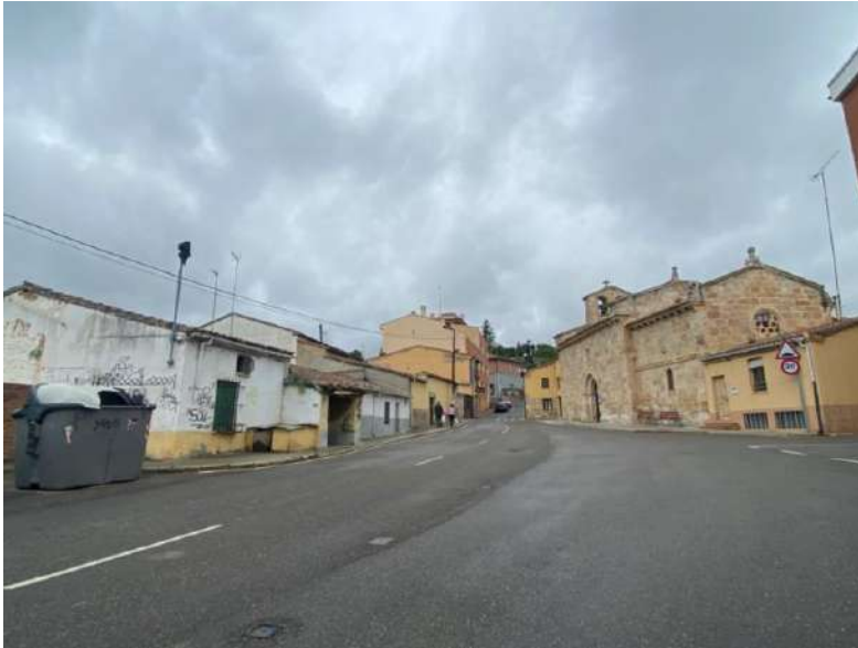
Iglesia románica del Espíritu Santo.