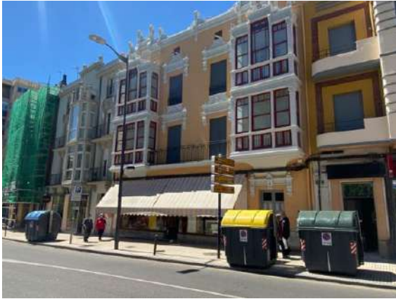
Avenida Alfonso IX, contenedores frente a fachadas recién restauradas.

No hay suficientes contenedores de reciclado en la ciudad, es un planteamiento unánime de la ciudadanía. La gente se esfuerza en separar y mejorar las prácticas ecológicas de reciclado y luego no encuentran contenedores para llevar la basura. Especialmente es preocupante el estado y la falta de contenedores de papel. Hay pocos y los que hay están en un estado pésimo.