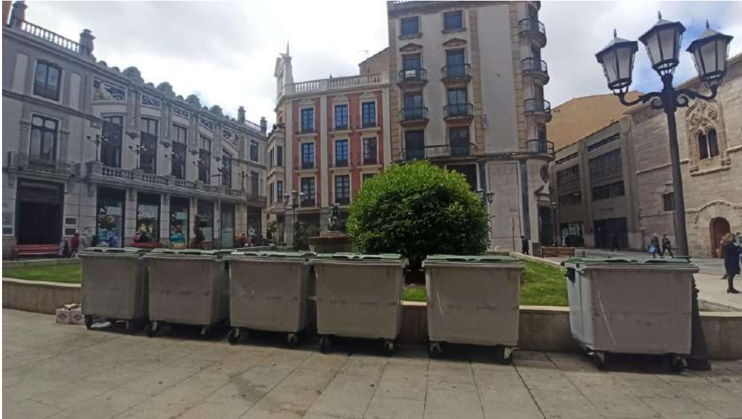
Plaza de Zorrilla, Palacio de los Momos y Maternidad de Lobo.