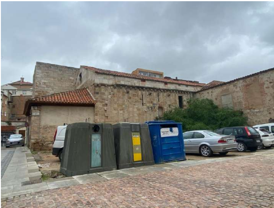
Iglesia románica de San Leonardo en La Horta.