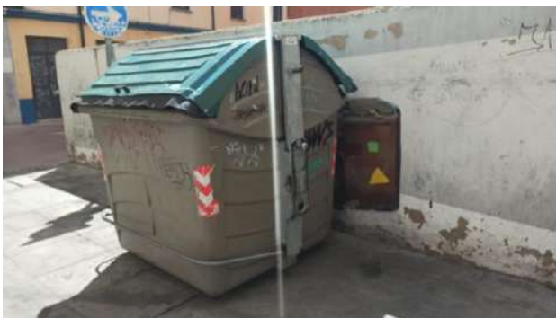
Antiguo mural en la Plaza del Maestro Haedo, junto a zona de bares y restaurantes.