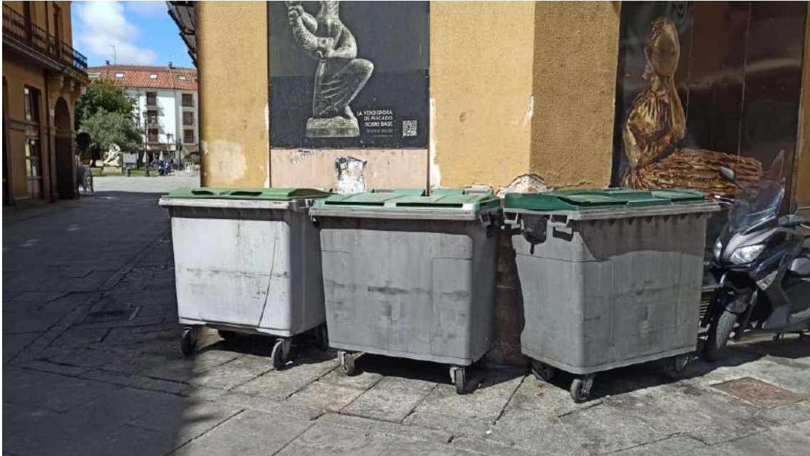
Plaza del Fresco – Plaza Mayor.